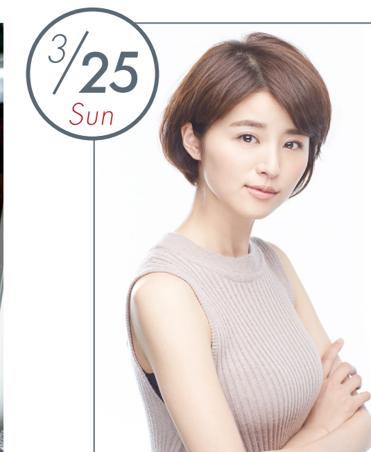
女優・モデル 鈴木ちなみ